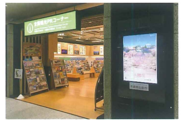
全国観光PRコーナー

昨年よりも来場者および売上も大きく伸び、今後も物産品を通して弘前のPRを行ってきたいと思ひます。