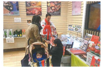
リンゴジュースの試飲を実施