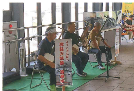
JR弘前駅での津軽三味線演奏